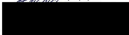
Bc. Klára Potůčková Zakázková a obchodní asistentka

Pokud výše hodnoty předmětu plnění Objednávky je vyšší než 50.000,- Kč bez DPH, vztahuje se na Objednávku akceptovanou Dodavatelem povinnost uveřejnění v registru smluv dle zákona č. 340/2015 Sb., o zvláštních podmínkách účinnosti některých smluv, uveřejňování těchto smluv a o registru smluv (zákon o registru smluv).