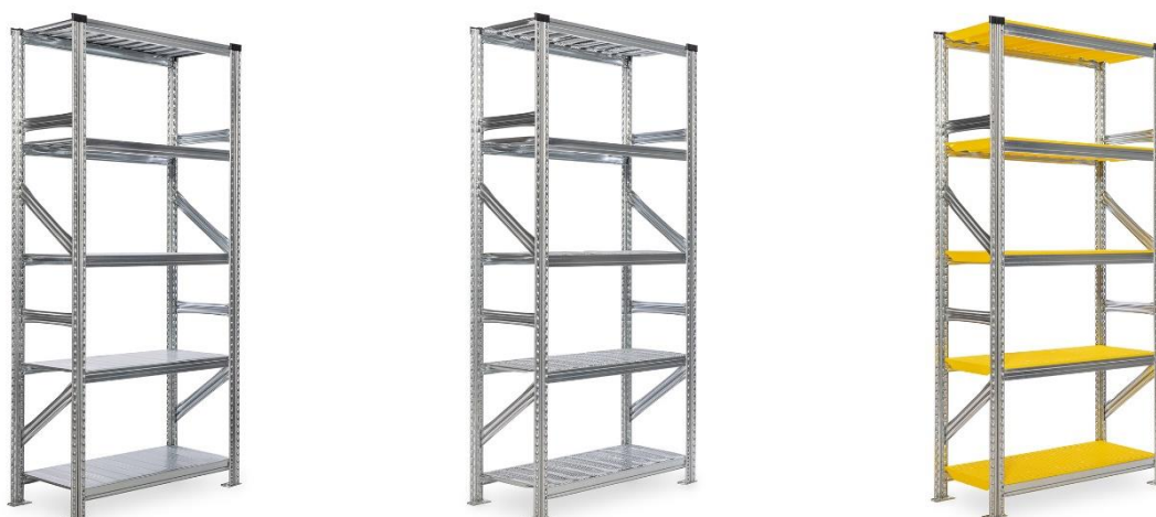
Ilustrativní foto. Příslušenství viz foto, není součástí nabídky.

Všechny regálové konstrukce splňují koeficient bezpečnosti 2,2 – to znamená, že při mezním namáhání unesou regály a jejich komponenty 2,2 násobek jmenovitého plošného zatížení. (Certifikátem TÜV)