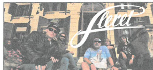
AKTUÁLNÍ FOTO JINÁ JEN S ODSOUHLASENÍM

FOTOGRAFIE, RL, PROMO TEXT ODESLÁNY EMAILEM DNE: 9.9.2021