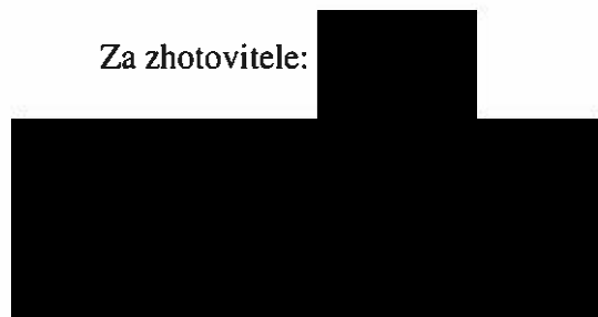
Bc. Martin Cech /

Muzeum Beskyd Frýdek-Místek, příspěvková organizace Hluboká 60 738 01 Frýdek-Místek DIČ: CZ00325530, IČ: 095030