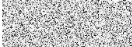
Za zhotovitele: Rudolf Jetmar