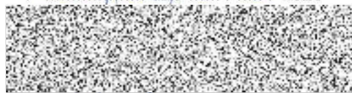
Anatolij Gafurov (poskytovatel)