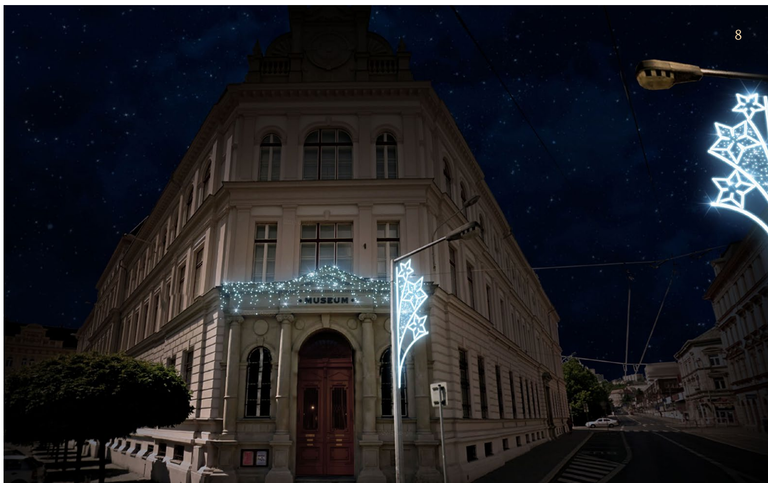
MUZEUM A DEKORACE VEŘEJNÉHO OSVĚTLENÍ