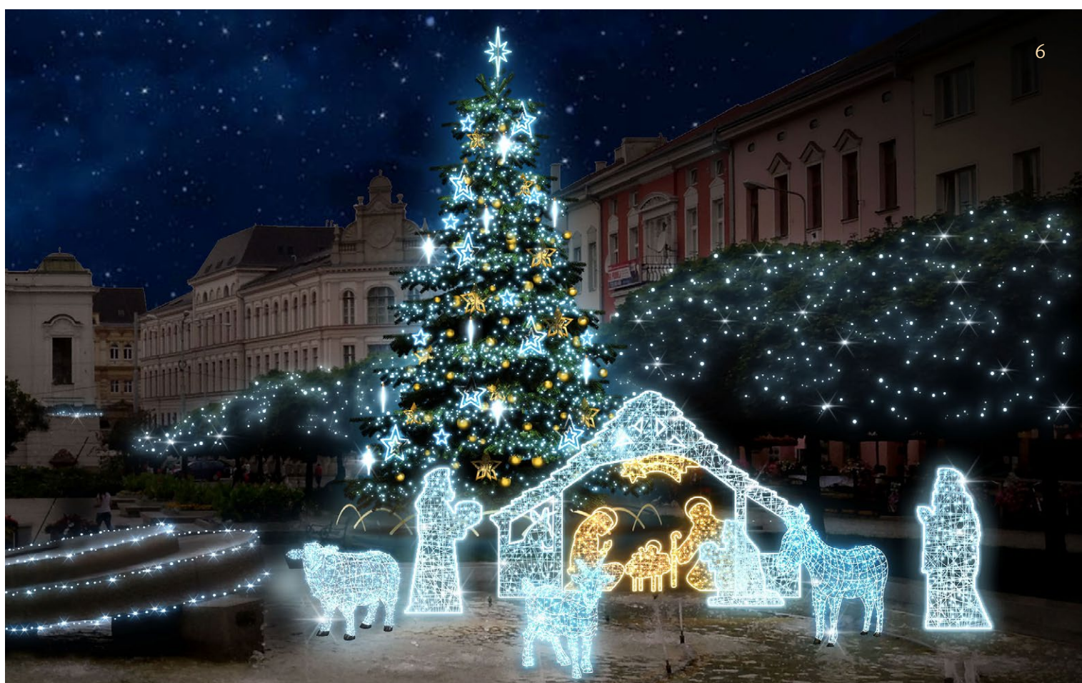
NÁMĚSTÍ - DETAIL