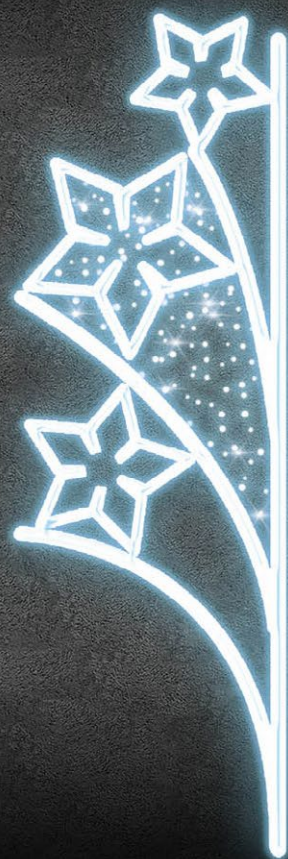
MOTIV VEŘEJNÉHO OSVĚTLENÍ - DETAIL 80 x 240 CM