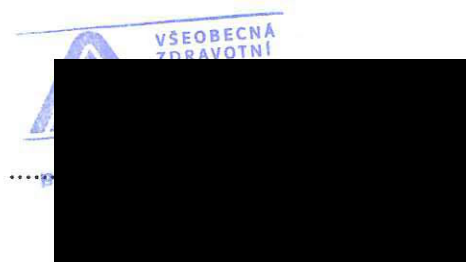
Vedoucí oddělení zdravotní péče Krajské pobočky VZP ČR pro Středočeský kraj SÚP Mladá Boleslav