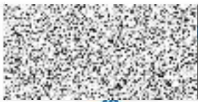
otisk úředního razítka

Dle § 152 odst. 3 písm. b) stavebního zákona je stavebník povinen před zahájením stavby umístit na viditelném místě u vstupu na staveniště štítek s údaji o povolení stavebních úprav a ponechat jej tam až do dokončení stavby. Nesplněním této povinnosti se stavebník dopouští přestupku dle § 178 odst. 2 písm. k) stavebního zákona, za který je v § 178 odst. 3 písm. d) stavebního zákona stanovena finanční sankce až do výše Kč 200.000,-.