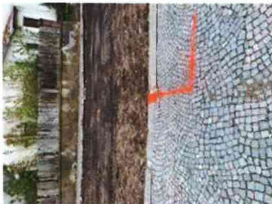
vytyčení VO z 19.5