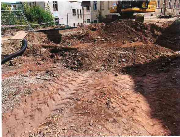
Přeložka ČEZ + Veřejné osvětlení v komunikaci km 0,160 a ukončení přeložky v levostranném chodníku