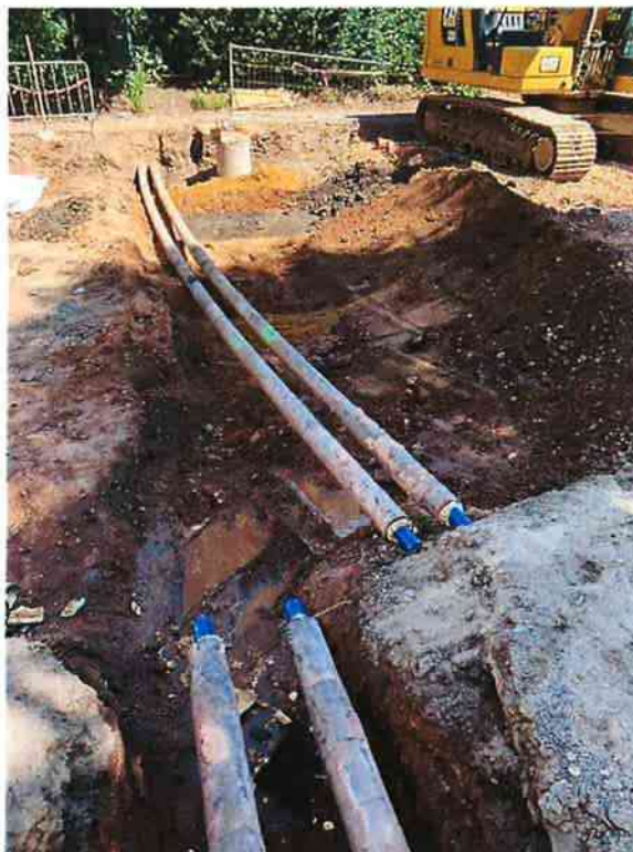
Zásyp potrubí po změně nivelety před betonáží krycí desky - Přeložka ČEZ Teplárenská