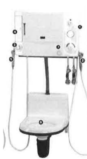
Výlevka s funkcí toalety