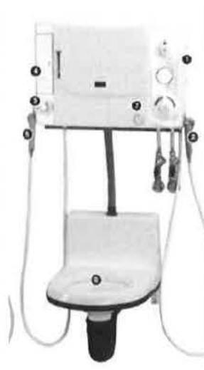
Výlevka s funkcí toalety