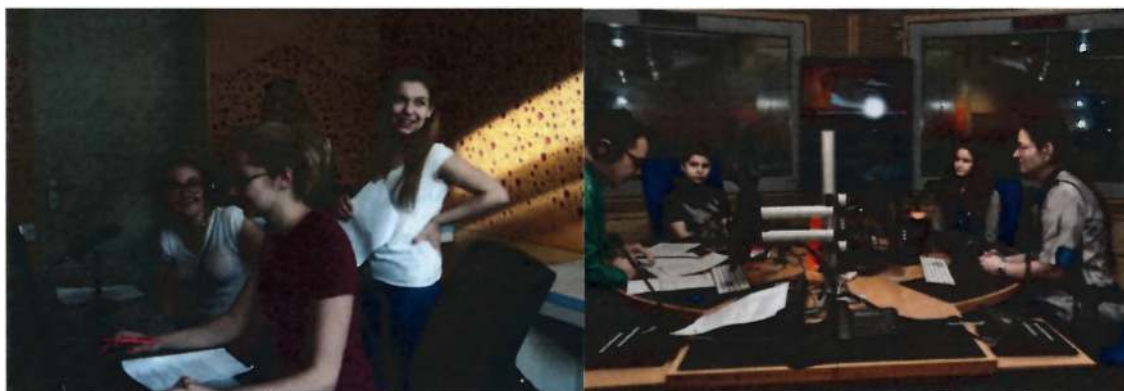
Workshopy ve studiu Českého rozhlasu

Aby byly výstupy žáků co nejlepší, mohou se v rámci projektu zúčastnit celé řady workshopů. Úvodní workshop Jak natočit pamětníka absolvují všechny týmy pod vedením regionálního koordinátora. Mediální workshopy vedou profesionální filmaři či rozhlasoví redaktori. Audio workshopy mohou proběhnout ve škole nebo také ve studiu Českého rozhlasu, kam zamíří ty týmy, které chtějí natočené vyprávění pamětníka zpracovat do rozhlasového dokumentu. Žáci si dopředu připraví scénář a ve studiu Českého rozhlasu svou nahrávku pamětníka za pomoci redaktora sestříhají do ucelené rozhlasové reportáže. Učí se práci rozhlasového redaktora a moderátora. Pracují tu také s profesionálním zařízením pro střih. Ty týmy, které se rozhodnou natáčet pamětníky na video záznam, mají možnost absolvovat video workshop. Nově nabízíme týmům také workshop narativních dovedností nazvaný Jak vyprávět příběh . Učí žáky, jak z velkého množství sesbíraného materiálu vybrat do výsledné reportáže to důležité. Pro týmy, které se rozhodnou pro animovaný film máme v nabídce i specializované workshopy pro přípravu a zpracování animovaného filmu.