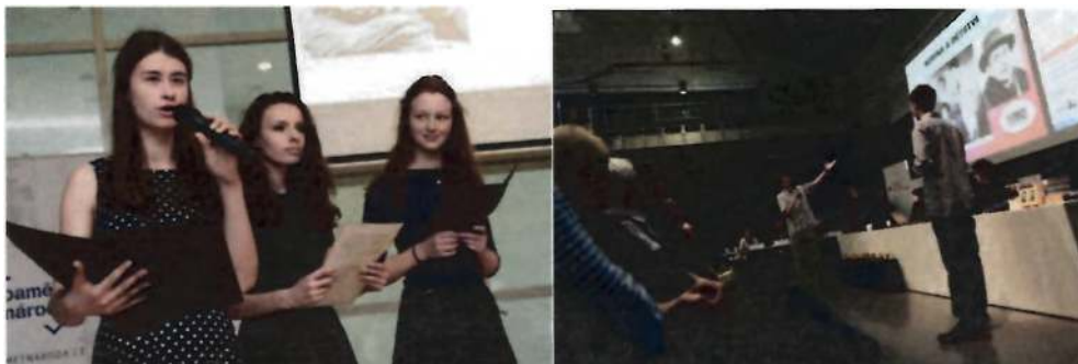
Slavnostní prezentace pamětnických příběhů