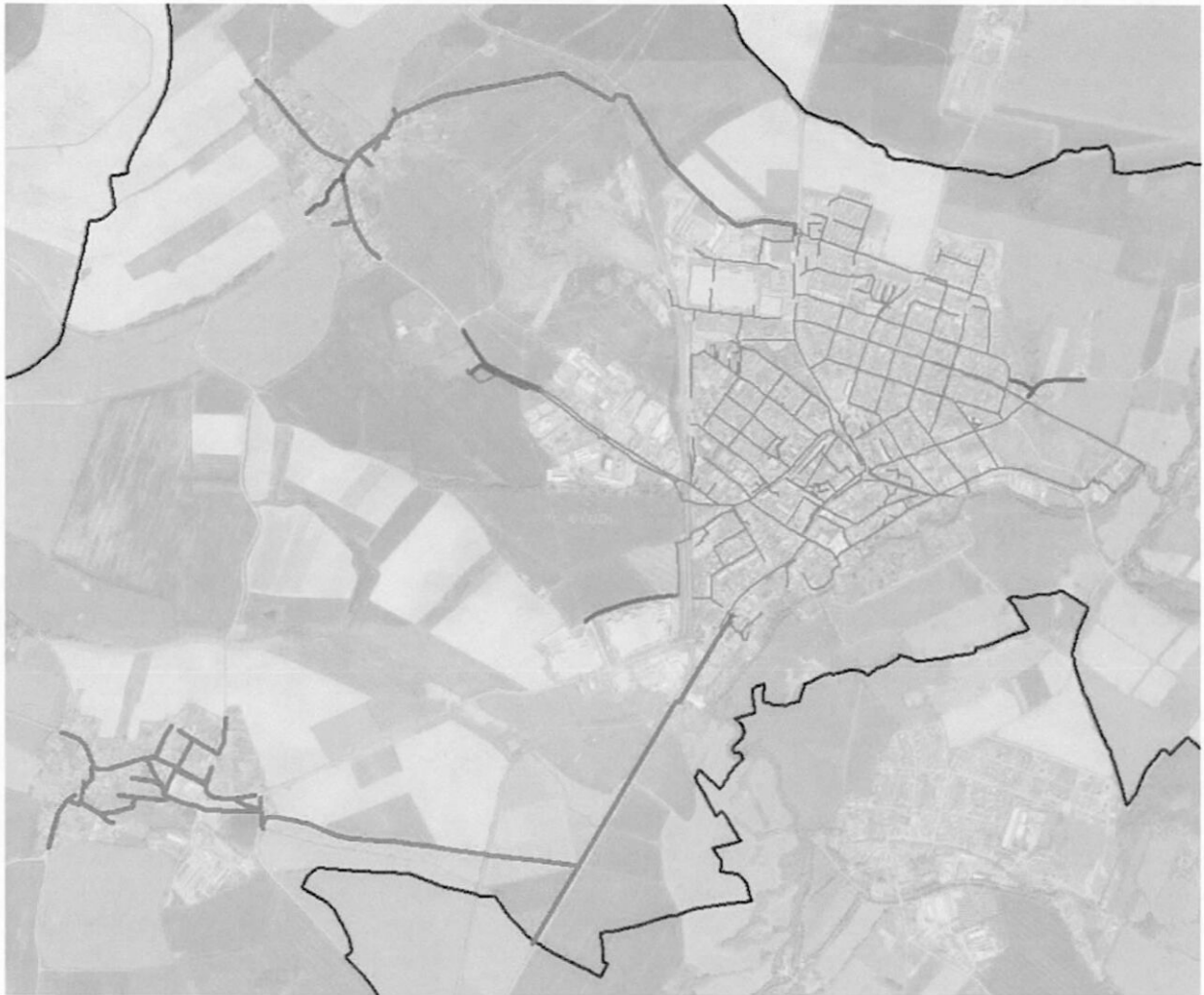
Obr. 1: Kanalizace Přeštice – Rozsah zpracovávané infrastruktury (Zelená – data k přepracování. Červená – úseky s daty ostatních přesností, určené k zaměření. Šedá – Data kanalizací zapracovaná do DTM DMVS PK v rámci předchozí dotační žádosti. V rámci tohoto projektu nebudou řešena. Hnědá – správní hranice města.)