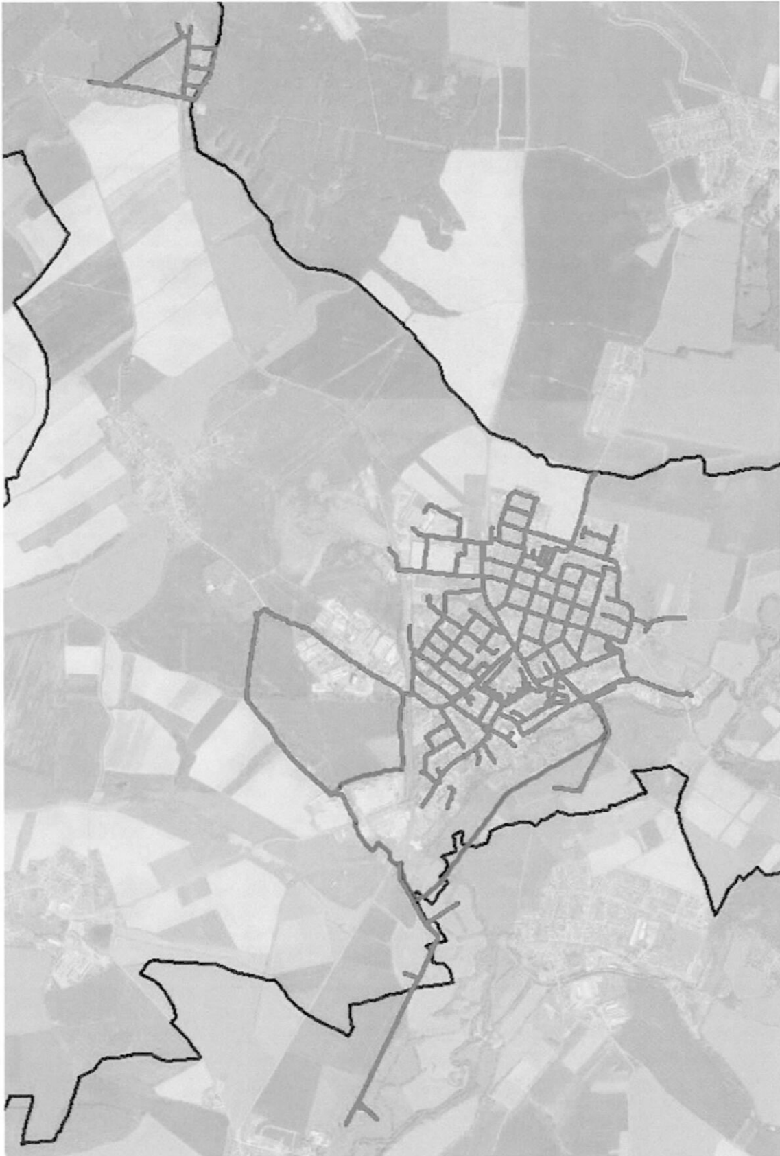
Obr. 2: Přeštice, vodovodní infrastruktura. (Zelená - data v přesnosti umožňující přepracování do DTM. Červená - nepřesná data nebo data bez určení původu, rozsah vodovodní sítě určené k zaměření. Hnědá – správní hranice města.)