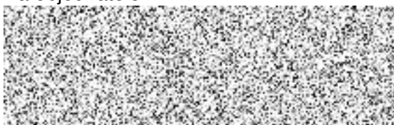
zástupce vedoucího ONM SLZ PP ČR