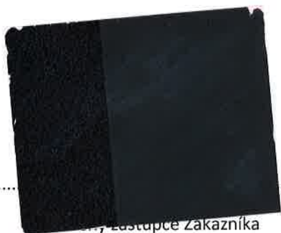
Oprávněný zástupce Zákazníka Otisk razítka Zákazníka