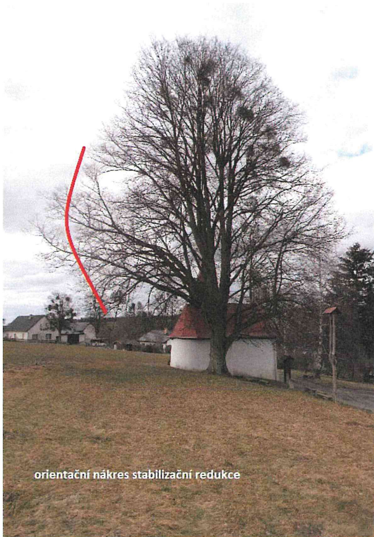
orientační nákres stabilizační redukce