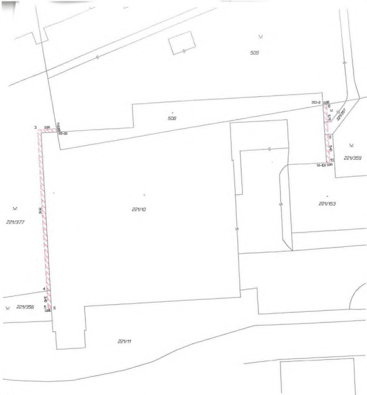
Seznam souřadnic (S-JTSK) Číslo bodu Souřadnice pro zápis do KN Y X KK Poznámka