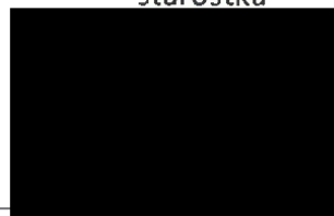
Silvie Pavlicková jednatelka

Doložka platnosti právního úkonu Uzavření této smlouvy bylo schváleno v souladu s ustanovením §85 zákona č. 128/2000 Sb., o obcích, ve znění pozdějších předpisů na zasedání Zastupitelstva města Tišnova konané dne 20. 9. 2021 usnesení č.: 21/18/5/2021