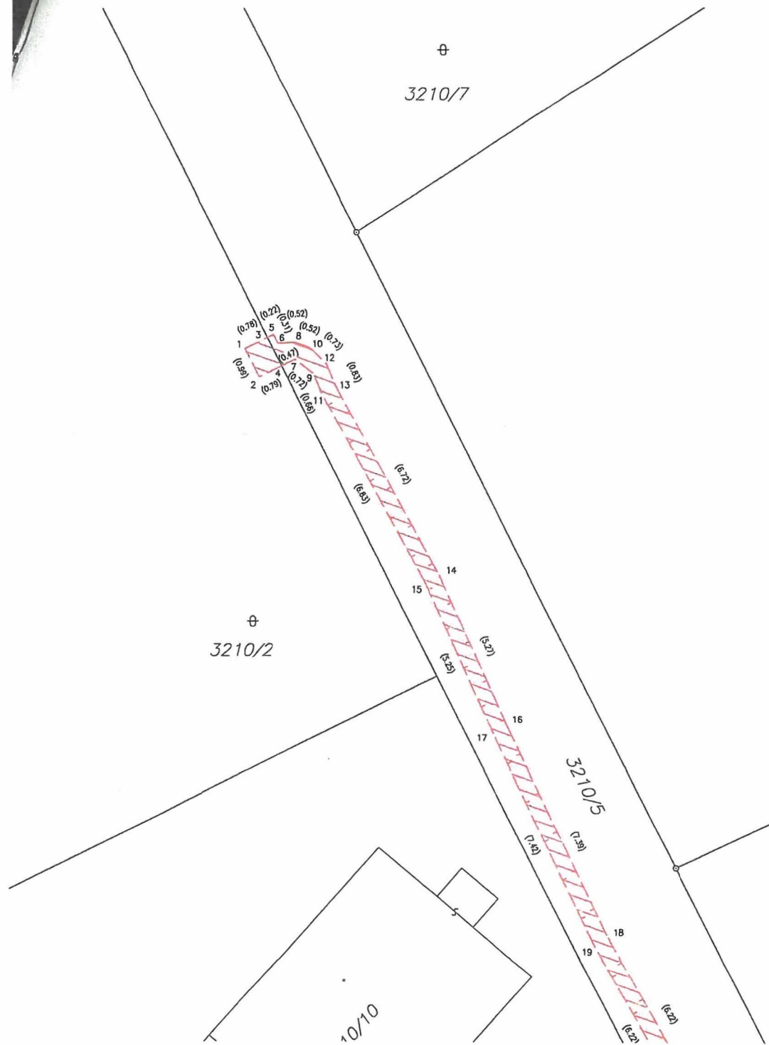
Seznam souřadnic (S-JTSK) Souřadnice pro zápis do KN