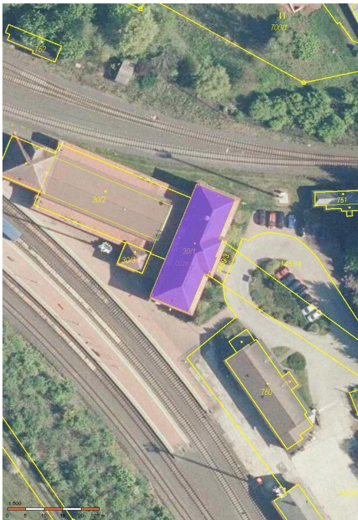
Příloha č. 1 situační plán budovy (budova vyznačena fialově)