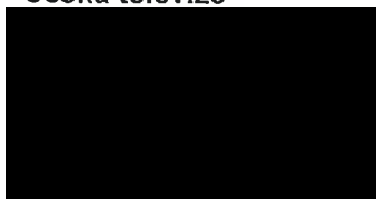
Lucie Goegebeur, obchodník