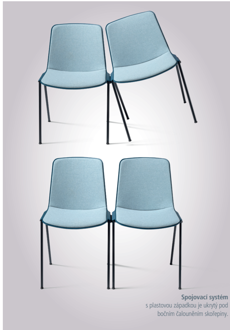
Spojovací systém s plastovou západkou je ukrytý pod bočním čalouněním skořepiny.