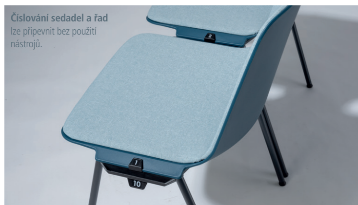
Číslování sedadel a řad lze připevnit bez použití nástrojů.