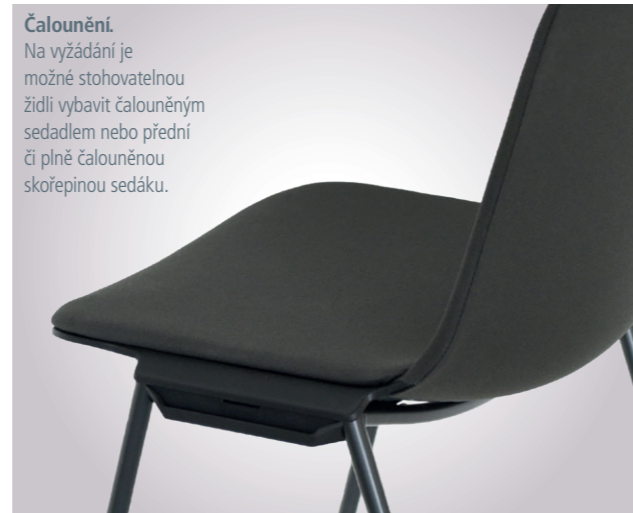
Čalounění. Na vyžádání je možné stohovatelnou židli vybavit čalouněným sedadlem nebo přední či plně čalouněnou skořepinou sedáku.