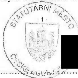
Ing. Jiří Svoboda primátor

Mateřská škola Jizerská 4 370 11 Česká Bělá IČO: 620 27 725