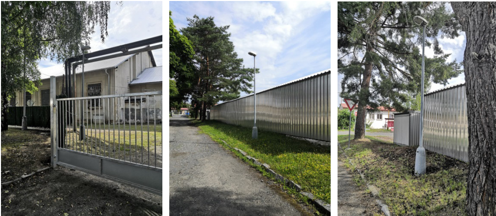
4. Oprava stožárového výbojkového osvětlení 3x – autopark (za ESO prístřeškem č. 027) kontrola uložení sloupů, oprava sloupů, oprava (výměna) výbojkových světel.