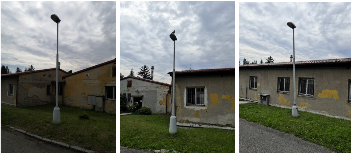
15. Oprava osvětlení – lampa parková 3x – komunikace u SO č. 036 oprava uložení sloupů, oprava sloupů, oprava (výměna) výbojkových světel.