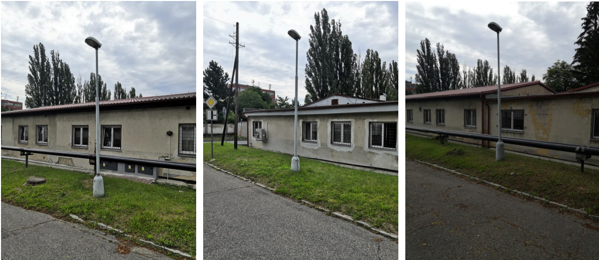
16. Oprava osvětlení – 1x výbojkové lampy na plášti SO č. 35 (boční vchod) oprava (výměna) výbojkových světel.