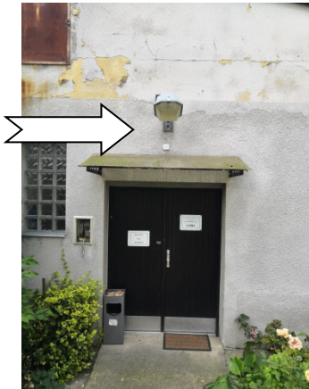
17. Oprava osvětlení – 1x výbojkové lampy na plášti SO č. 35 logistika, metrologická laboratoř oprava (výměna) výbojkového světla.