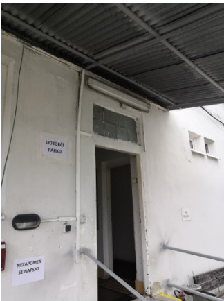
7. Oprava osvětlení (světlo voděodolné) 1x – SO č. 040 nad brankou.