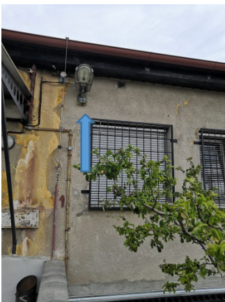
18. Oprava osvětlení – 1x výbojkové lampy na plášti SO č. 035 logistika, metrologická laboratoř oprava (výměna) výbojkového světla.