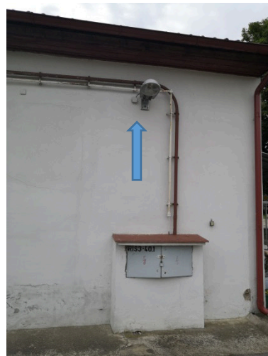
9. Oprava osvětlení – 2x výbojkové lampy na plášti SO č. 004 (služební a hlavní vchod )