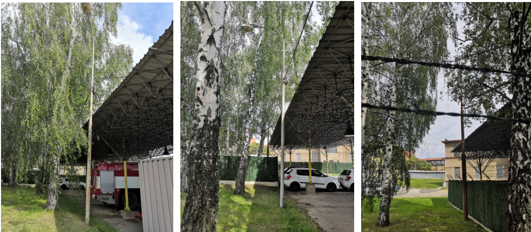
5. Oprava stožárového výbojkového osvětlení – autopark SO č. 123 2x dvouramenná lampa (celkem 4 kusy světel) kontrola uložení sloupů, oprava sloupů, oprava (výměna) výbojkových světel.