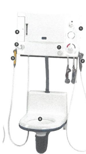
Výlevka s funkcí toalety