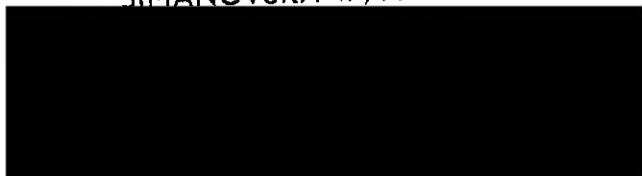
Kateřina Blažková odběratel

PRAHA 14 KULTURNÍ ŠIMANOVSKÁ 47, PRAHA 9