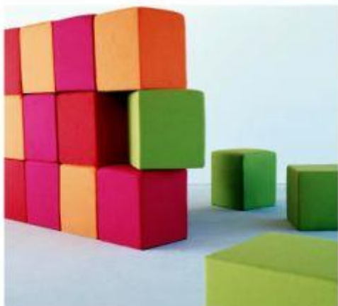
Obrázek č. 4 - dětská židle kostka