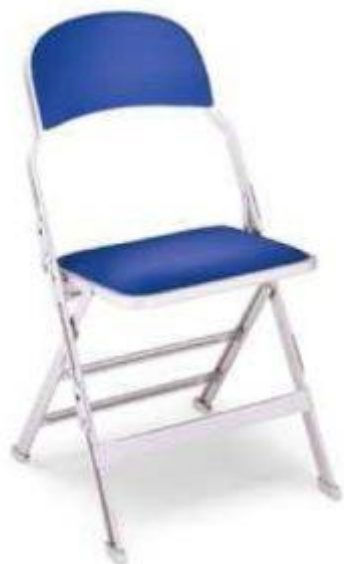
Obrázek č. 1 - židle do galerie