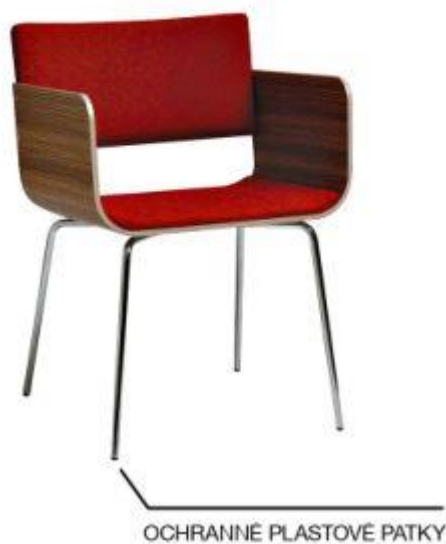
Obrázek č. 3 - křesílka do odd.