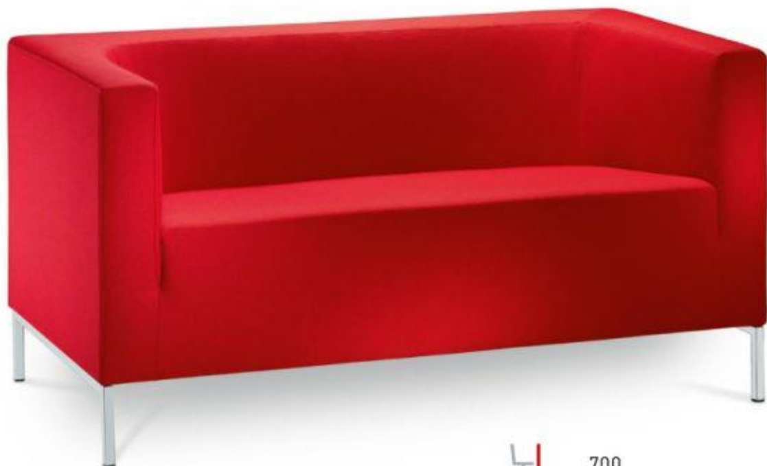
Obrázek č. 2 - pohovka v ředitelně