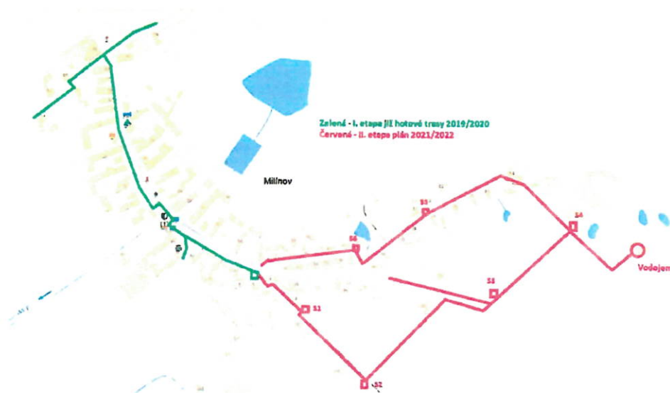
Obr. Schéma budované optické sítě , zelené = hotové trasy, červené = tento projekt