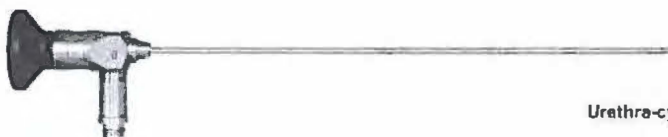
Urothra-cystoscopy, arthroscopy, hysteroscopy, otoscopy (without sheath)