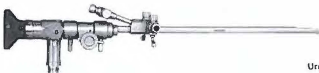
Urothra-cystoscopy, arthroscopy, hysteroscopy, otoscopy (with sheath)