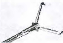
Pelican Jaws Type Grasping Forceps