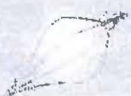
Fold Angular Basket Type Grasping Forceps