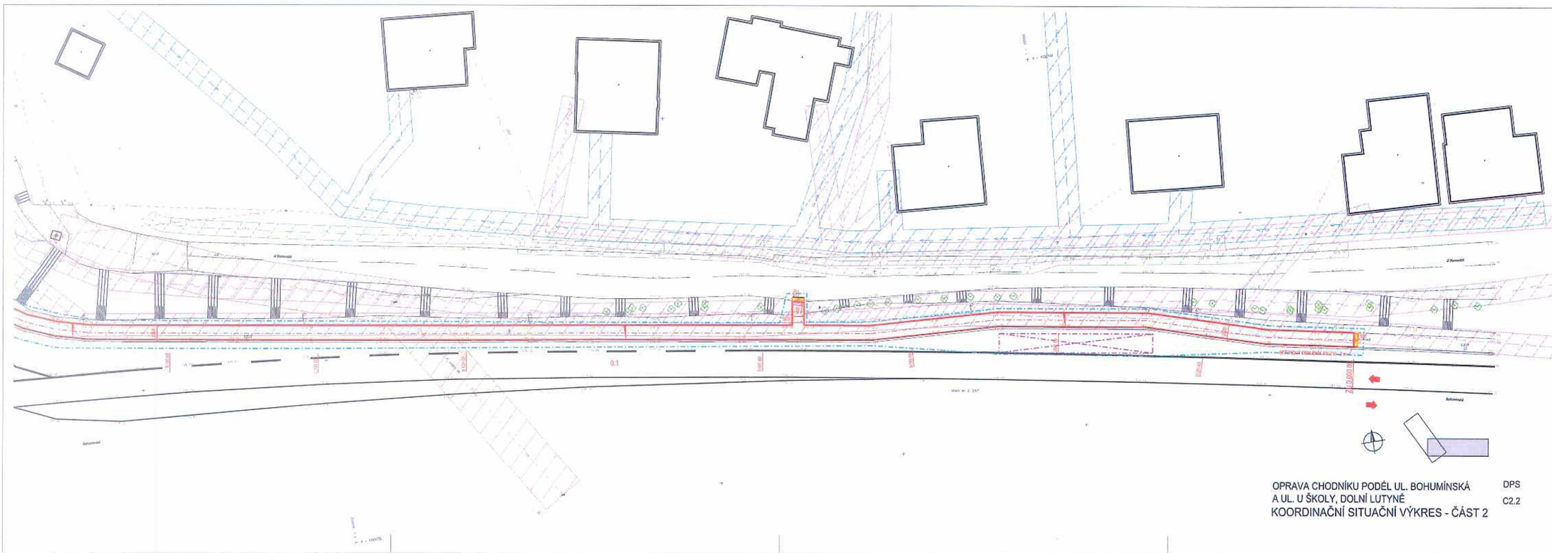
OPRAVA CHODNIKU PODÉL UL. BOHUMÍNSKÁ A UL. U ŠKOLY, DOLNÍ LUTYNĚ KOORDINAČNÍ SITUÁČNÍ VÝKRES - ČÁST 2