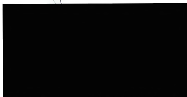
Vodohodpodářský rozvoj a výstavba a.s.