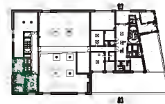
SCHÉMA UMÍSTĚNÍ PŮDORYS 4.NP

♦ ZAŘÍZENÍ, KTERÉ NENÍ SOUČÁSTÍ TOHOTO VYBĚROVÉHO ŘÍZENÍ (ZAKRESLENO POUZE PRO KOORDINACI)