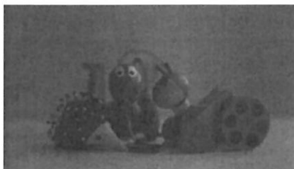
E.I. 8000 applied

👁️ The Exposure Index (E.I.) , with eight selections, brightens the image by increasing the camera's effective ISO - it's like adding light to the subject. E.I. adjusts the image tone curves in software without affecting the native data.