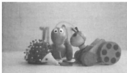
E.I. 40,000 applied