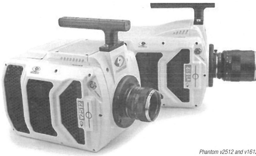
Phantom v2512 and v1612