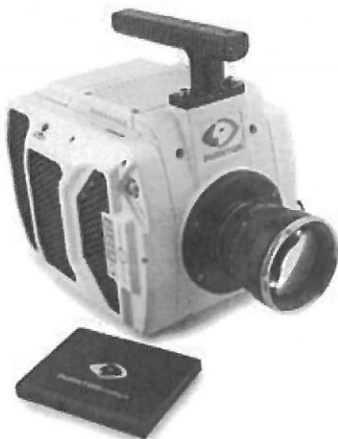
Phantom v1212 with CineMag®