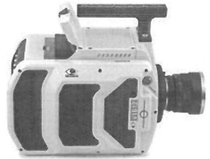
v1612 with 2TB CineMag

Phantom® v2512 Phantom® v2012 Phantom® v1612 Phantom® v1212