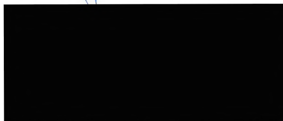
..... jednatel společnosti Vodohodpodářský rozvoj a výstavba a.s.