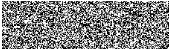
náměstek ředitele Správy logistického zabezpečení PP ČR Ministerstvo vnitra ČR

MINISTERSTVO VNITRA ČR Policejní prezidium ČR Správa logistického zabezpečení