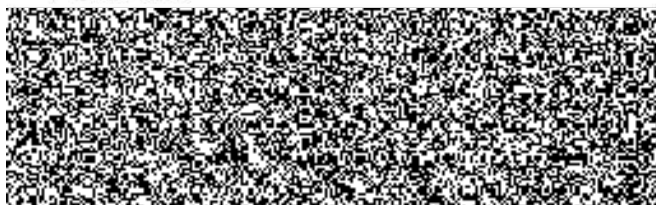
za objednatele Miloš Valach vedoucí Oddělení provozu a údržby majetku