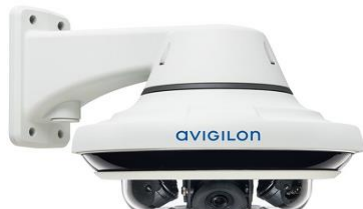
Avigilon 24C-H4A-3MH-270 + příslušenství