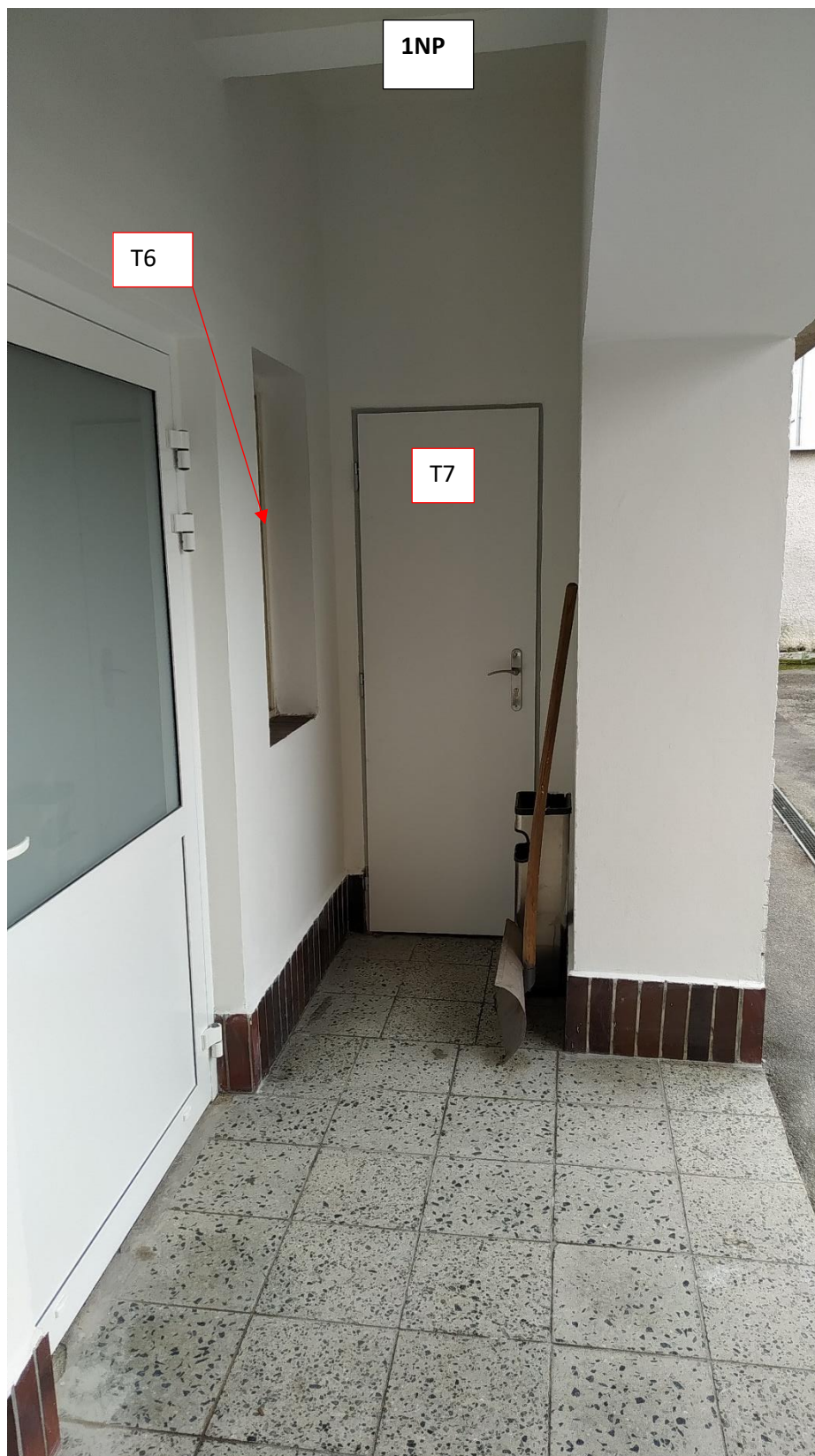
Přílohy: Přehled provedení nových oken a dveří