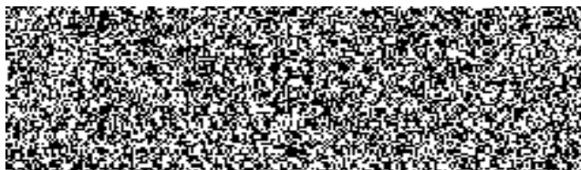
jednatelka společnosti INTERIER TECH s.r.o.