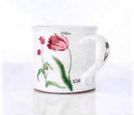
Hrnek rovný 350 ml

Logo ČZU u ucha hrnečků Na spodní straně hrnečků czu.cz