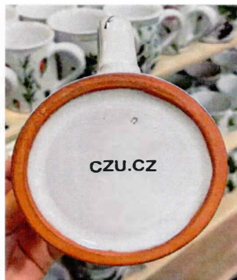
Hrnek buclatý 700 ml varianta a)