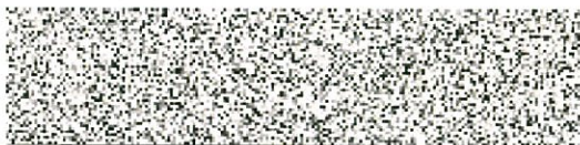
Statutární město Jihlava