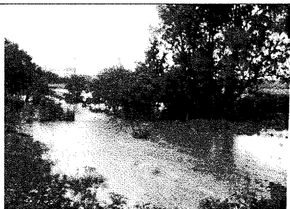
Obrázek 2 U mostu směr Dešná