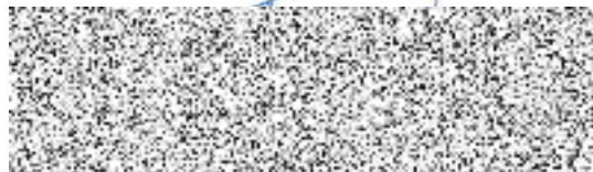
Jméno: Vlastimil Žána

Funkce: prokurista JP-KONTAKT s.r.o. Dašická 1797 530 03 Pardubice