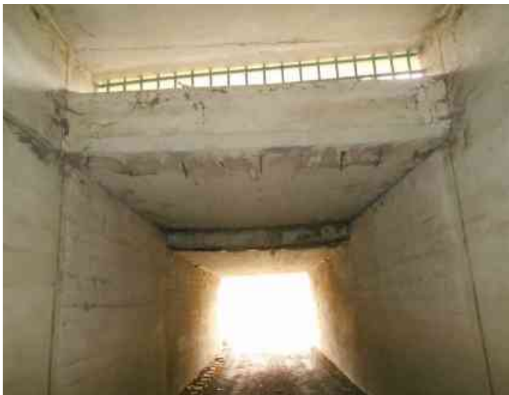
Pohled na pravý bok mostu