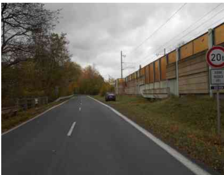
Pohled na stávající průběh vozovky nad mostem