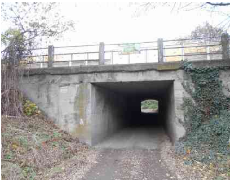
Pohled na levý bok mostu