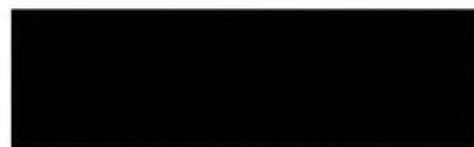
člen Grantové komise