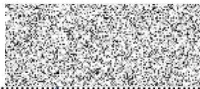
..... Mgr. Jana Skopalíková , radní pro oblast životního prostředí a zemědělství

Bactrianus z.s. Zájezd 5 273 43 Buštěhrad Česká republika IČ: 07749716 DIČ: CZ07749716