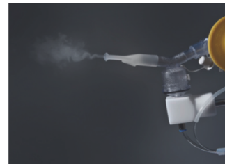
DeVilbiss 646 vytvářející mlžinu

Malá a tichá kompresorová jednotka s 3D stativem na stůl umožňuje realizaci provokačních testů bez centrálního zdroje stlačeného vzduchu. Funguje na principu bolusové metody s nebulizačním časem 0,6 sekundy. Vestavěný tlakový senzor detekuje začátek inhalace pro spuštění nebulizátoru. Filtr absorbuje exhalovaný aerosol, aby byla ochráněna obsluha. Disponuje rychlospojkou pro připojení nebulizátoru k jednotce kompresoru. LCD displej zobrazuje počet nebulizací a nabídky kompresoru. Dezinfikovatelná membránová klávesnice slouží pro spuštění testu a servisní rutinu. Pro snadnější připojení a vyloučení omylů jsou všechny konektory barevně značené. Stojan na tři nebulizátory v rámci volitelného příslušenství. Nebulizátor DeVilbiss 646 dle standardu ATS.