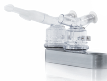
stojan na nebulizátory