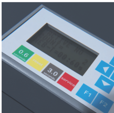
LCD Displej a dezinfikovatelná klávesnice