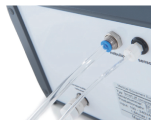
barevné rozlišení konektorů