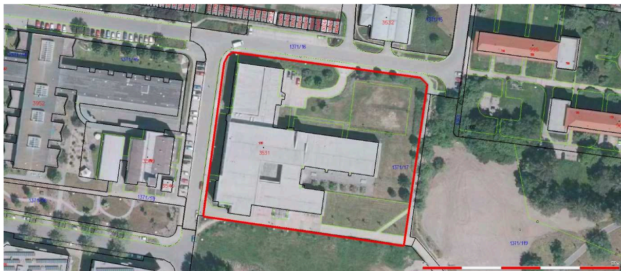
Areál 2. stupně základní školy F. L. Čelakovského