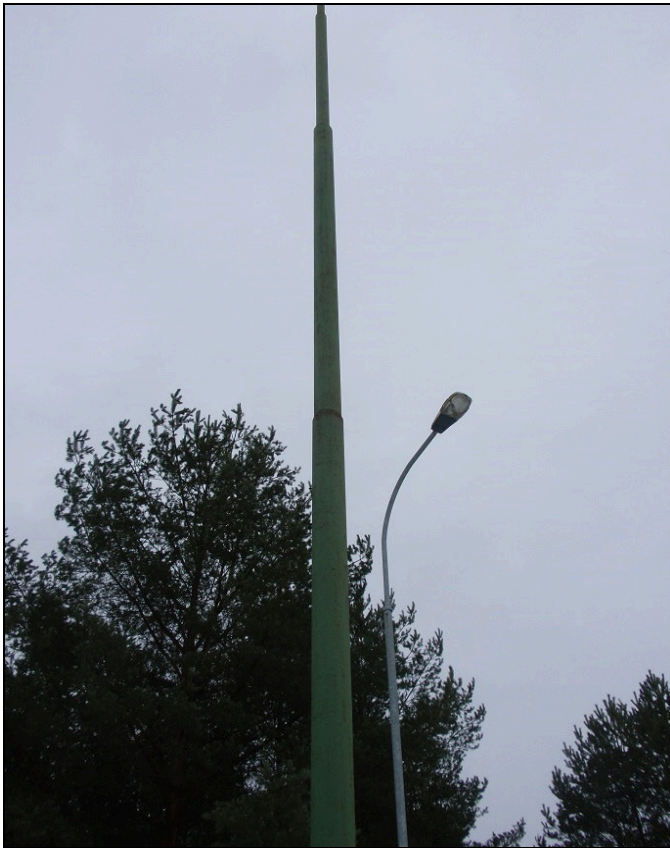
Foto č. 1 - Pohled na oddálený hromosvod